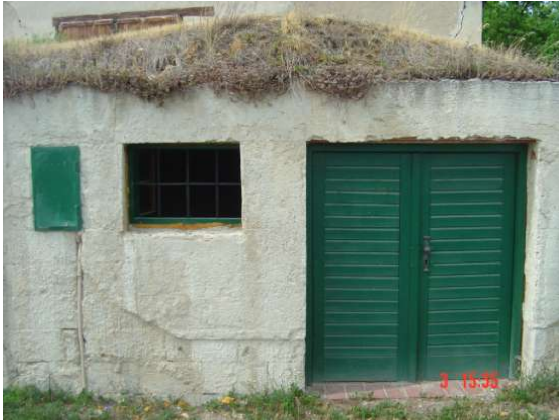
12. Preßhaus: grau verputzt; links: grüner Zählerkasten; Fenster mit grünem Holzrahmen und schwarzem Metallgitter, verglast; rechts: grüne, zweiflügelige Holztür, Schlossblech mit Metallgriff am rechten Flügel.