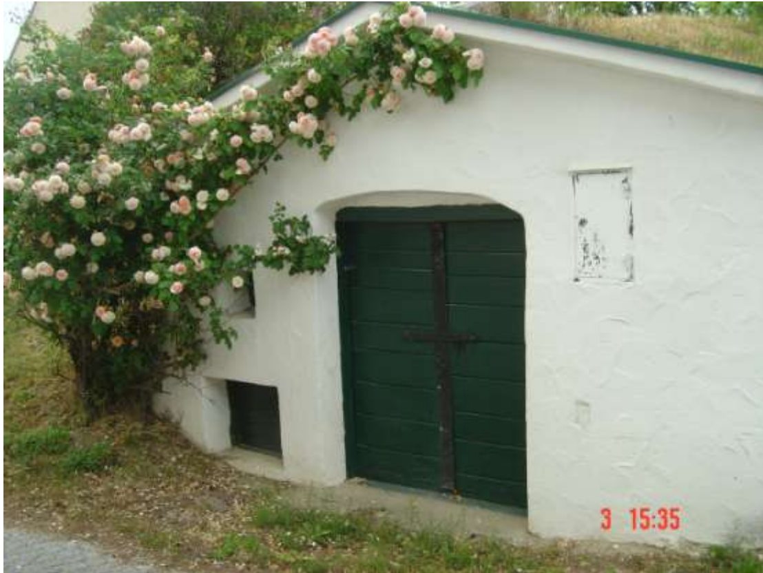
11. Preßhaus: weiß verputzt; links: Fenster mit grünem Lochgitter, darunter Gailloch mit grünem Holzdeckel; mittig: grüne, zweiflügelige Holztür, schwarze Schlagleiste mit Querriegel; Inschrift: AG; rechts: Zählerkasten: weiß, abgeblättert, darunter grün; Rosenbusch.