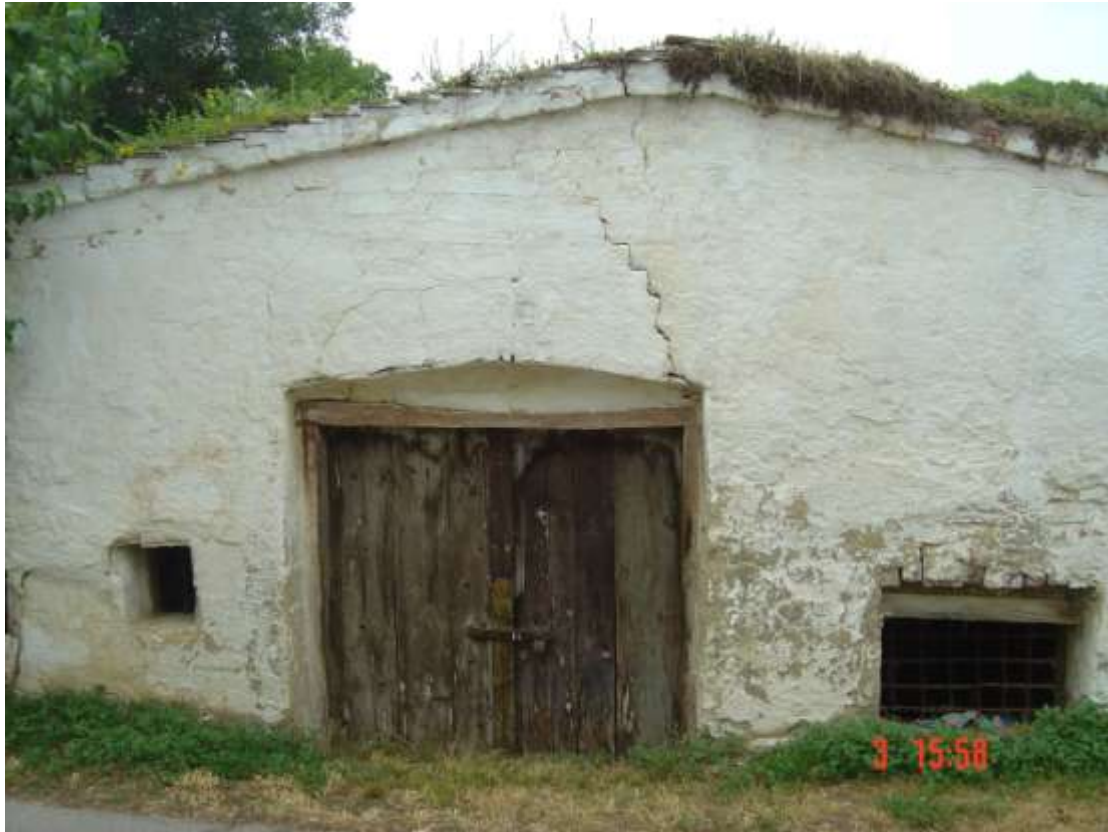
19. Preßhaus: weiß verputzt; links: offene Luke; mittig: naturbelassene Holztür auf niedrigerem Niveau als Straße; rostige Schlagleiste, Querriegel mit Bügelschloss rechts; rechts: Gaitloch mit rostigem Metallgitter.