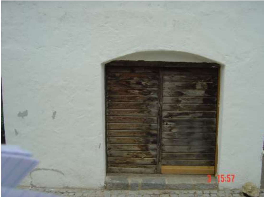
17. Preßhaus: weiß verputzt; zweiflügelige, naturbelassene Holztür, Schlüsselloch am rechten Türflügel; rechter Türbalken und rechter Türflügel unten renoviert; grauer Zählerkasten an der rechten Seite des Hauses.