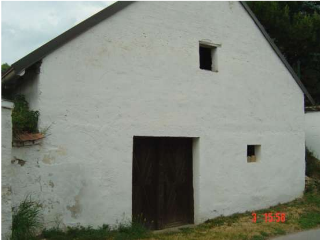
18. Preßhaus mit Schüttkasten: weiß verputzt, links: alte, naturbelassene, zweiteilige Holztür mit Mittelbalken, aufgedoppelt mit geschmiedeten Nägeln, Schlossblech rechts; rechts: Fenster mit 2 Metallstreben; 1. Stock: offene Luke mit sichtbarem Überlager aus Holz.