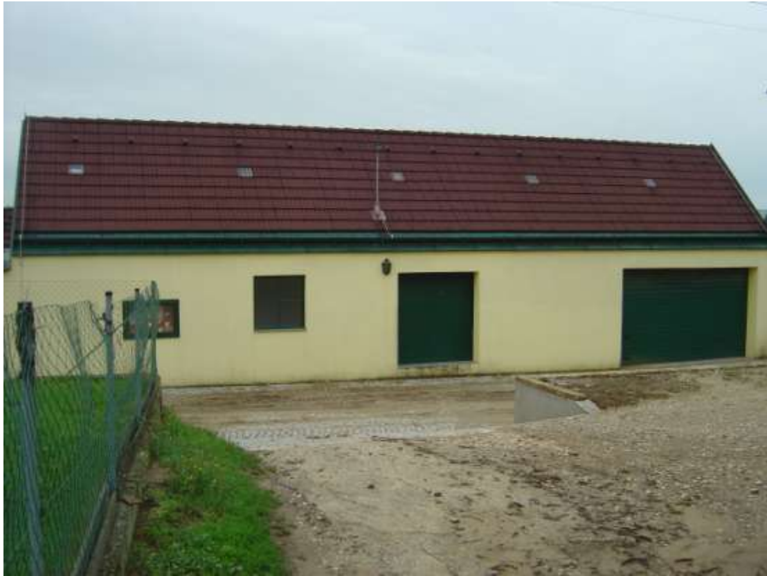
16. Preßhaus neuer Art: gelb verputzt; an der linken Seite der Gasse; links: grüne Tür mit schwarzem Türdrücker rechts; Auslage mit grünem Rahmen, verglast; Fenster mit grünem Rahmen, Fensterbrett aus Stein; grüne, zweiflügelige Holztür; grünes Tor aus Metall, schwarzer Griff links unten.