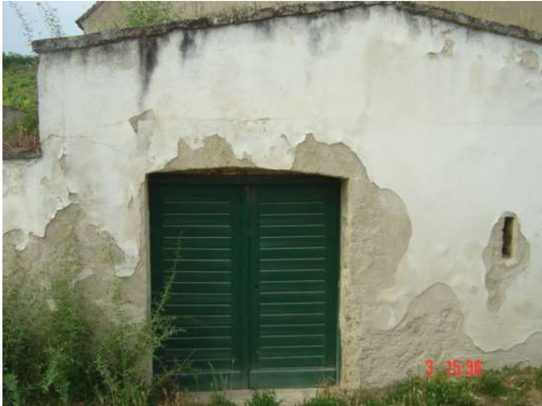
13. Preßhaus: weiß verputzt, derzeit teilweise abgeblättert; links: grüne zweiflügelige Holztür, Schlüsselloch rechts; rechts: Schießscharten-ähnliche Luke.