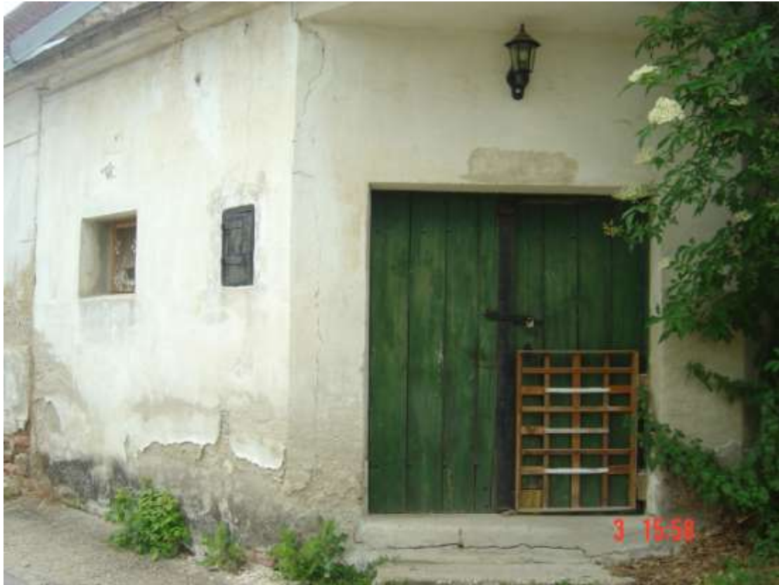
20. Preßhaus: links: Fenster mit braunem Rahmen, verglast; schwarzer Zählerkasten; in die abgeschrägte Hausecke eingelassen: grüne, zweiflügelige Holztür mit schwarz-rostiger Schlagleiste, Schlossblech rechts, Querriegel schwarz mit Bügelschloss rechts; niedriges Gärgitter aus großteils naturbelassenem Holz; Laterne.