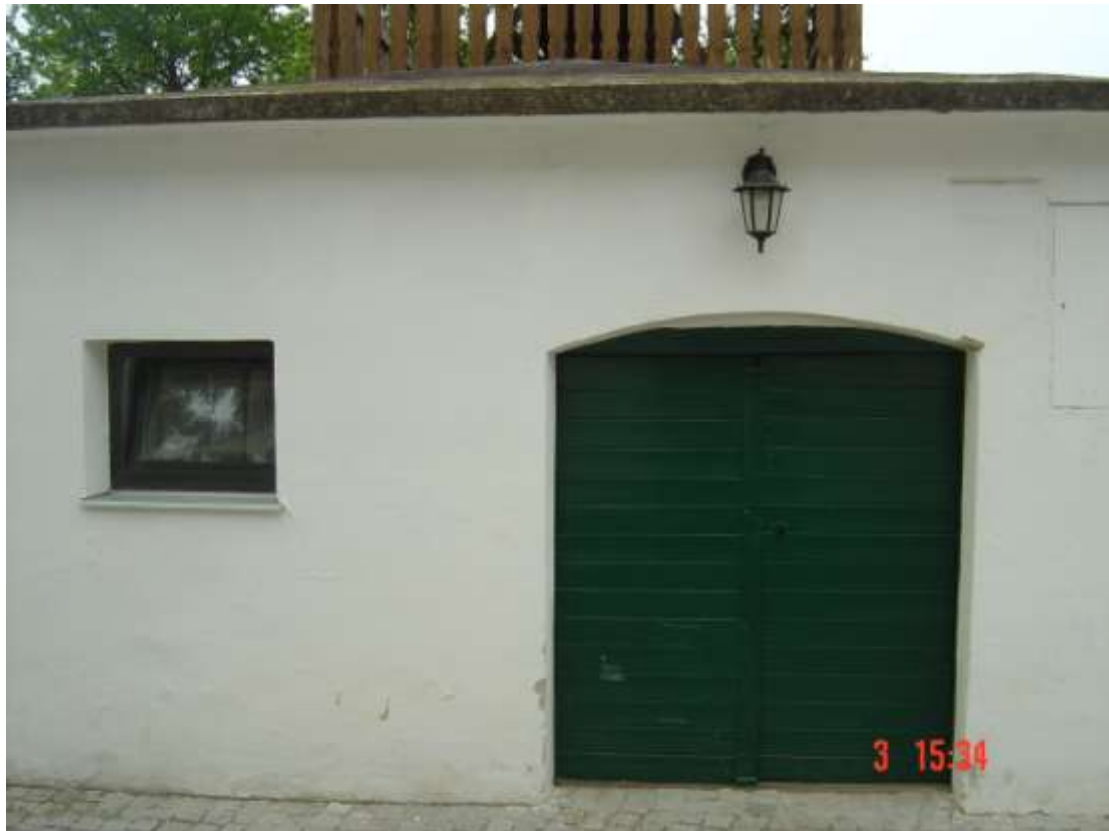
10. Preßhaus: weiß verputzt, links Fenster, brauner Rahmen, verglast; rechts: grüne Holztür mit grüner Schlagleiste, Schlossblech rechts; schwarze Laterne.